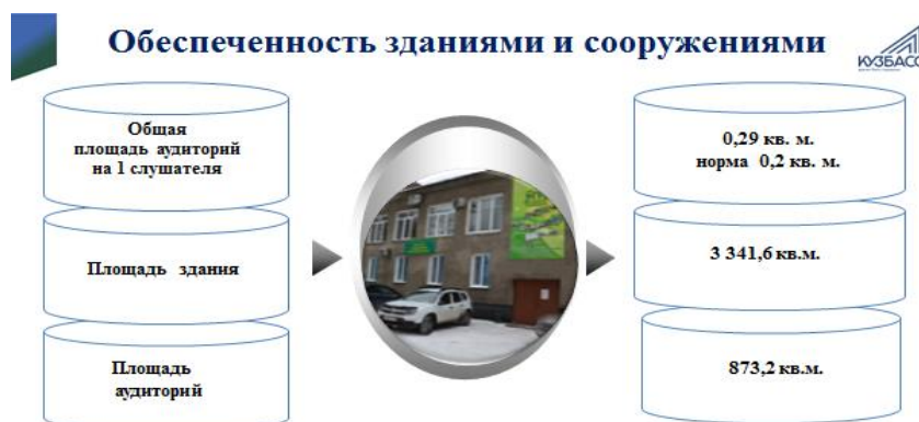
Рисунок 1 – Обеспеченность МАОУ ДПО ИПК зданиями и сооружениями

В оперативном управлении МАОУ ДПО ИПК находится здание по адресу г. Новокузнецк, ул. Транспортная, 17 площадью 3341,6 кв. м. (площадь аудиторий – 873,2 кв. м.). Общая площадь аудиторий на 1 слушателя составляет 0,29 кв. м. при норме 0,2 кв. м.